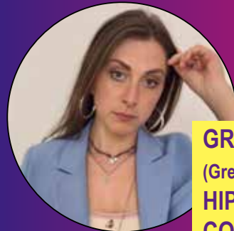
GRE (Greta Trabucchi) HIPHOP COREOGRAFICO